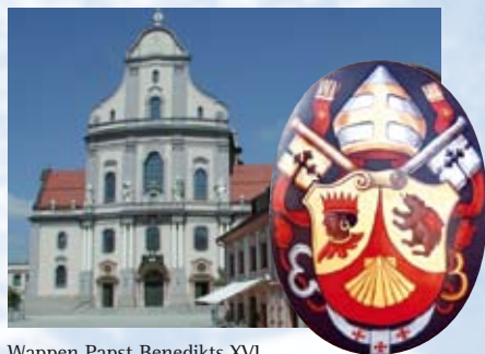
Wappen Papst Benedikts XVI. über dem Portal der Altöttinger St. Anna-Basilika.

Im Rahmen seiner ersten offiziellen Reise nach Bayern vom 9.-14. September 2006 besuchte Seine Heiligkeit Papst Benedikt XVI. neben München und Regensburg am 11. September auch die Wallfahrtsstadt Altötting, die er als „meine geistliche Heimat“ bezeichnete.