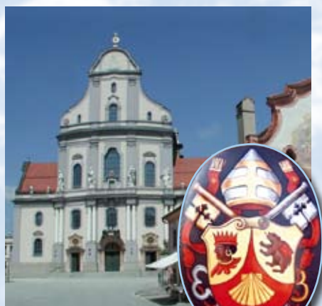
Godło papieża Benedykta XVI nad portalem bazyliki św. Anny w Altoetting.

Papież Pius X mianował w 1913 r. kościół pielgrzymów Św. Anny, bazyliką i jest uwieczniony tu na ołtarzu. Posłał także w roku 1907 kielich (Ziborium) zrobiony w lionńskiej pracowni złotniczej, który razem z Goldene Ruessl 1404 r. jest do zobaczenia w skarbcu w Altoetting.